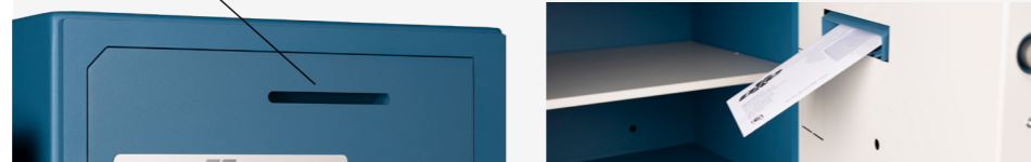
125 x 10

Kit interface alarma Alarm interface kit Kit interface alarme